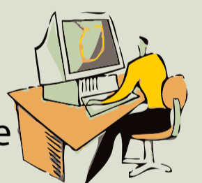
L'Assistant à Maîtrise d'Ouvrage