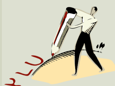
Trois bureaux d'études associés pour l'animation et le conseil technique