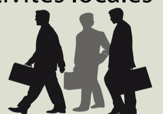
Les services de l'Etat, les collectivités locales et les Chambres Consulaires