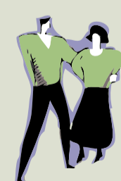
Les habitants, associations et acteurs du territoire